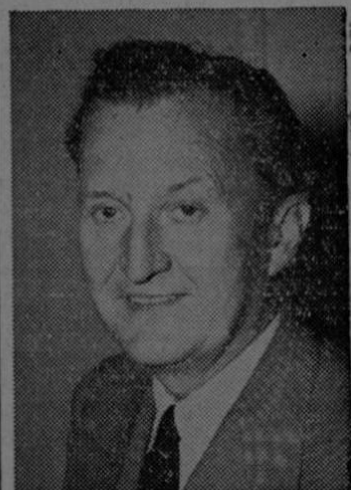
El señor Benton

Como parte de los esfuerzos realizados por la Secretaría de Estado para fomentar la libertad de información, según afirmó el señor Benton, los funcionarios están explorando las posibilidades de un plan de negociaciones bilaterales con otros países. Estas negociaciones tendrán por objeto eliminar las barreras económicas y políticas que obstruyen el intercambio de información, y estimular acatamiento al principio de libertad de información tanto dentro de los límites de cada país como en sus relaciones con los demás.